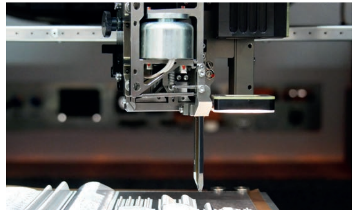
HBK Dickdraht Bondkopf